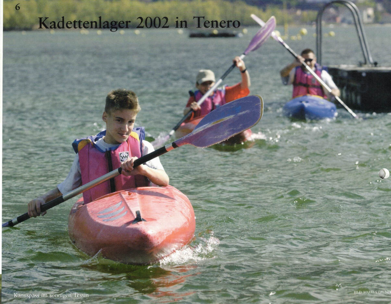
Kanuspass im sonnigen Tessin